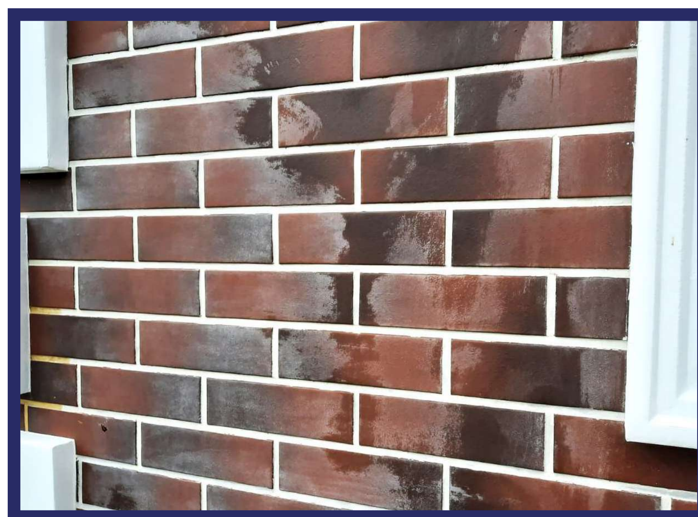
Размазали смывку по всему фасаду