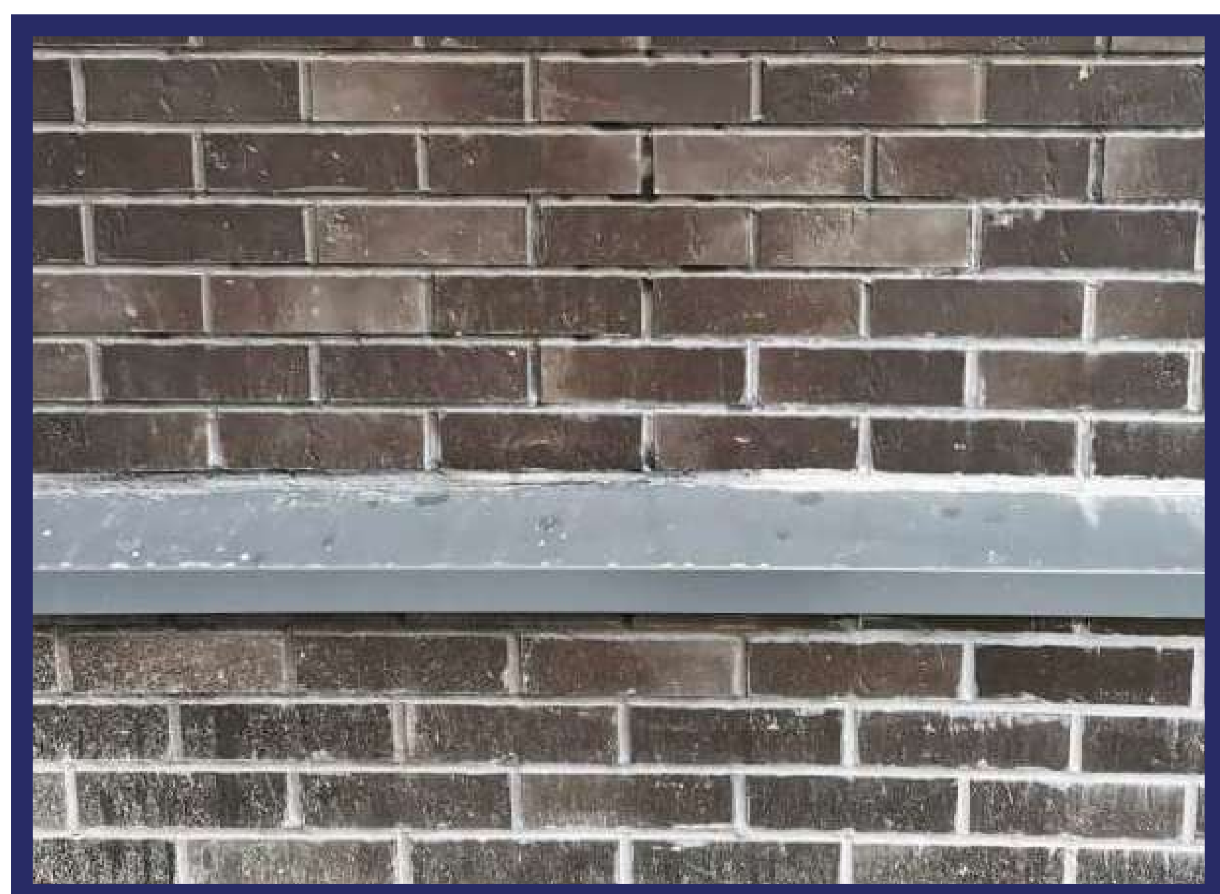
Фасад испачкан брызгами с лесов и земли