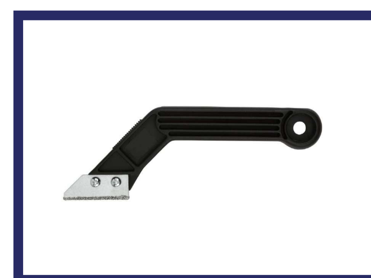
Инструмент для расшивки швов с алмазным напылением