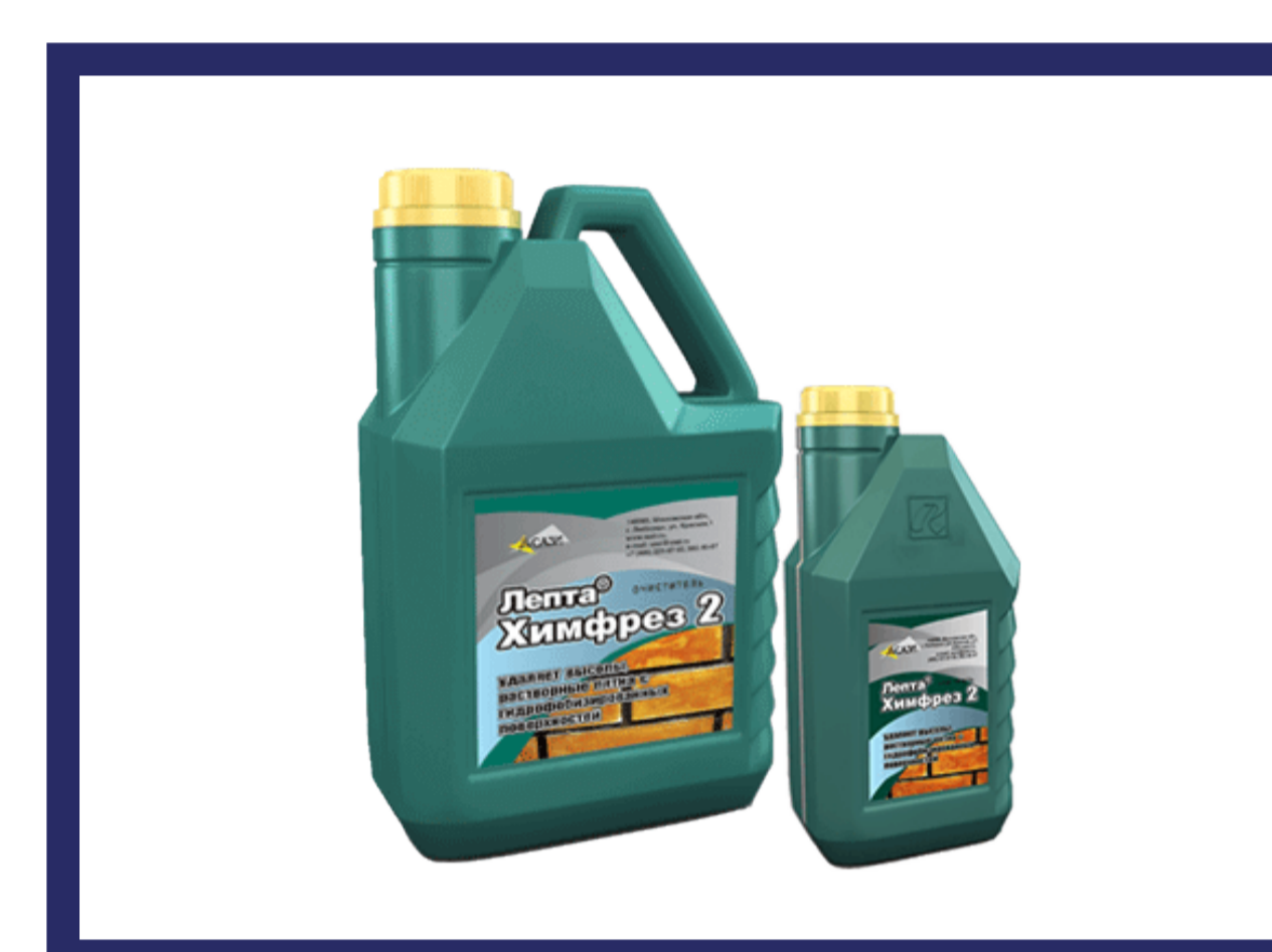
Лепта Химфрез 2