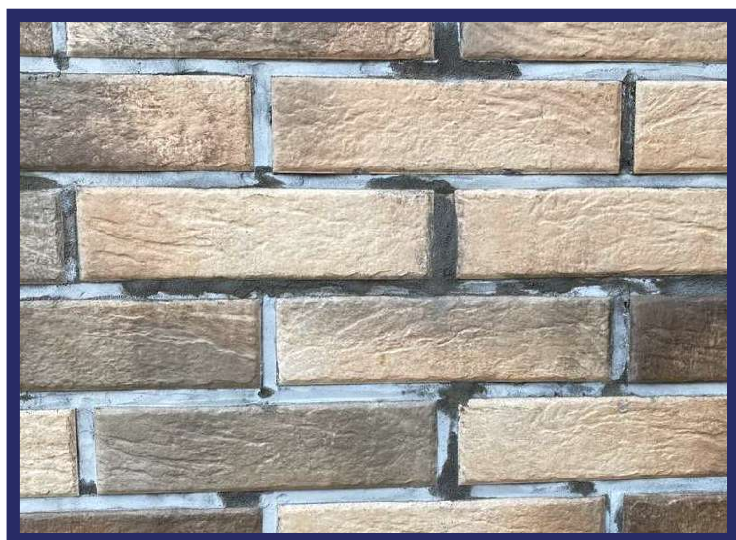
Расшивку выполняли по сырому материалу, заглаживая шов, смачивая инструмент