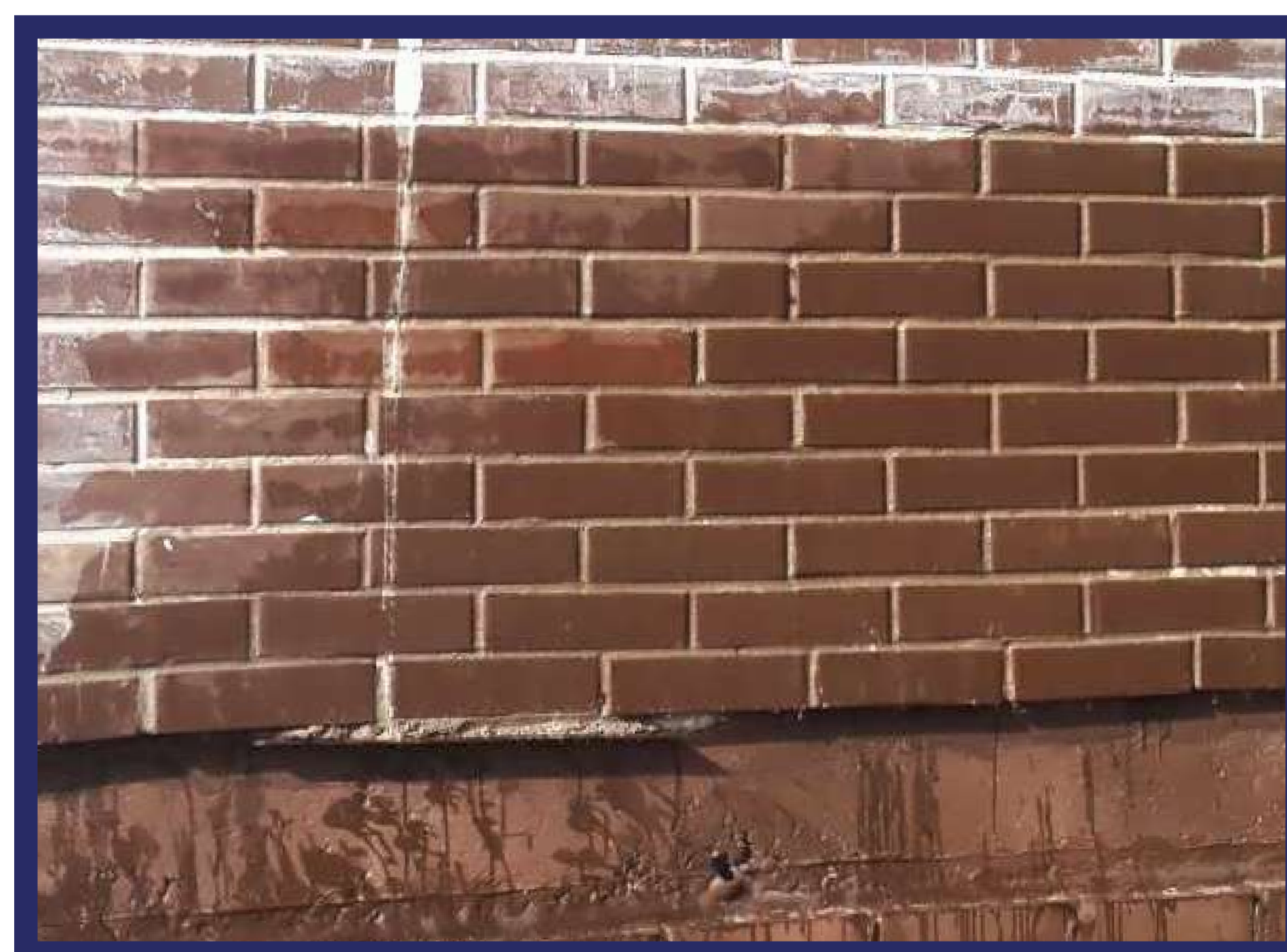
Фасад не защитили от дождя