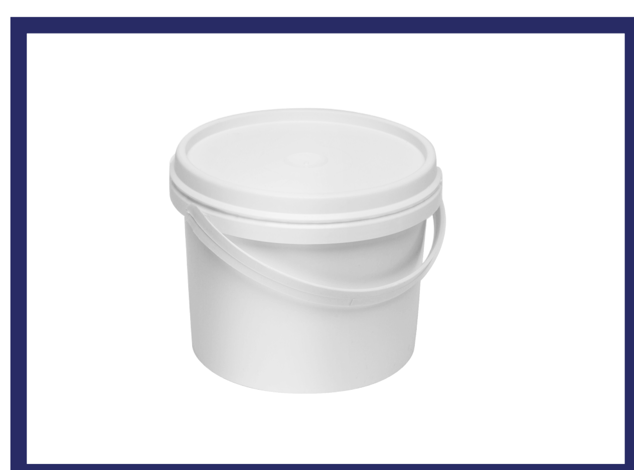
Емкость с крышкой

Для рекомендуемого выполнения работ, вам понадобятся: удобная емкость, жесткая кисть из щетины (возможно ее придется подрезать, чтобы она стала жестче), чистая ветошь, инструмент для расшивки и зачистки швов.